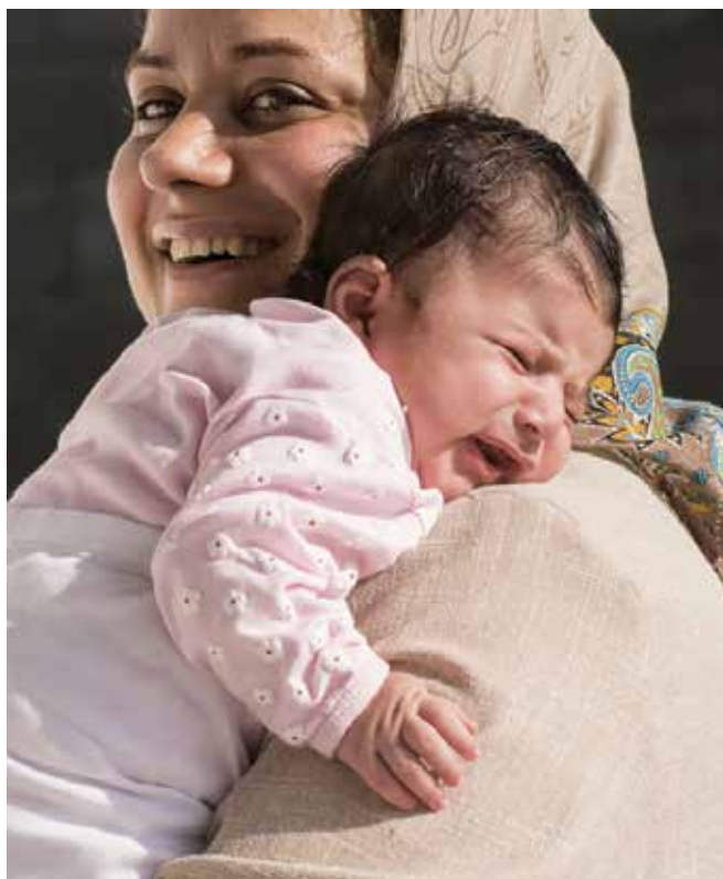
Kinderen zijn gratis verzekerd.

De medicijnen en fysiotherapie zijn duur dus ga ik een aanvullende verzekering afsluiten aan het einde van het jaar.